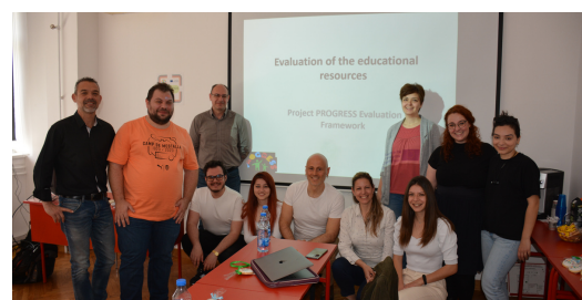
Source: Pictures were taken during the TPM in Belgrade, Serbia.