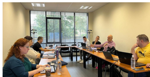
Source: Fotografije su uslikane tokom sastanka u Sofiji, Bugarskoj.